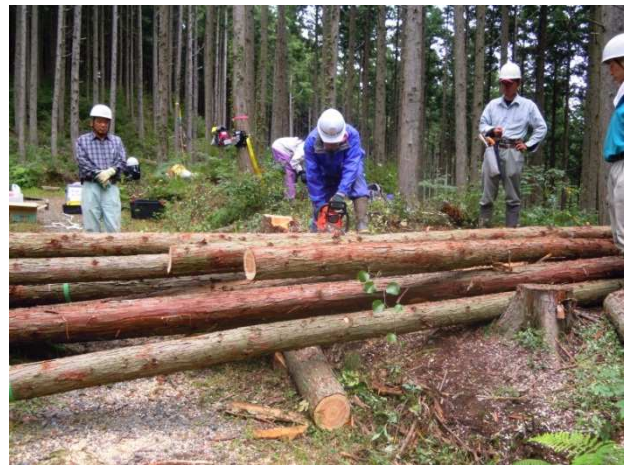
上げられた材を交代で造材する参加者

この研修を経て、多くの山林所有者が「山の宝でもう一杯プロジェクト」に関心を持ち出し、その後のフォローアップ研修にも、のべ 70 名が参加されました。「チェーンソーのソーチェーンも目立てをせずには切れなくなったら新しく買っていた。目立てから教えて欲しい。」という声がたくさん聞かれ、目立てに力を入れた研修も増やしました。参加者の意識が前向きに変化していることを実感しました。