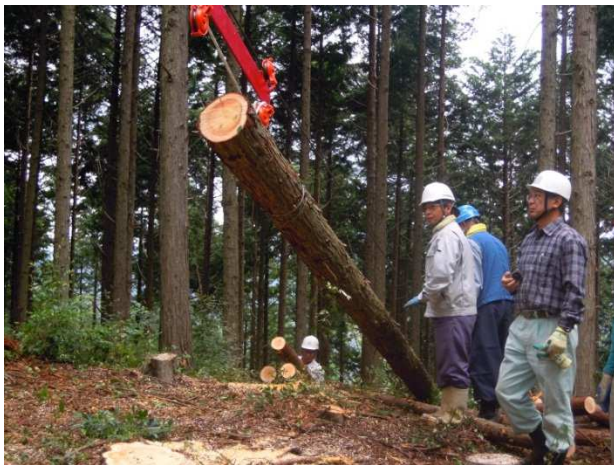
軽架線でどんどん集材が進むことに感心する参加者

翌 2 日も、昨日に続き、町内の山林所有者を中心に約 40 名が集まりました。20 名ずつの午前・午後交代制で、「PC ウインチによる集材」、「土佐の森軽架線キッドによる集材」で研修を実施しました。PC ウインチは集材のみでなく、クレーンの代わりもします。(写真左上)