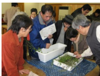
七草を実際に確認