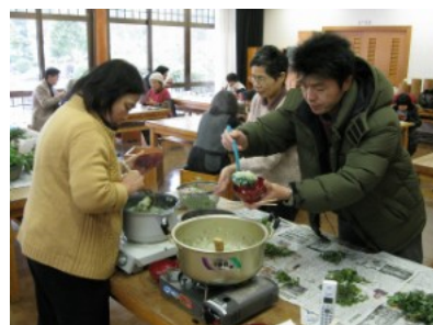
七草粥おいしくいただきました