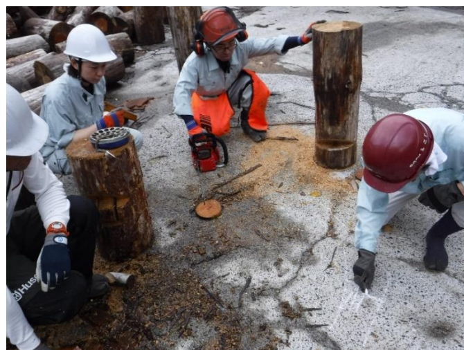
【森の名手・名人による地域おこし協力隊の自伐林業 研修 (益田市匹見町)】

今後は、今までの活動に加え、新しく山林を購入して森林経営を実践する若者への支援や、林業事業体の中で新しい未来を創造して行くような人物を育成して行くことにも挑戦して行きたいと考えています。