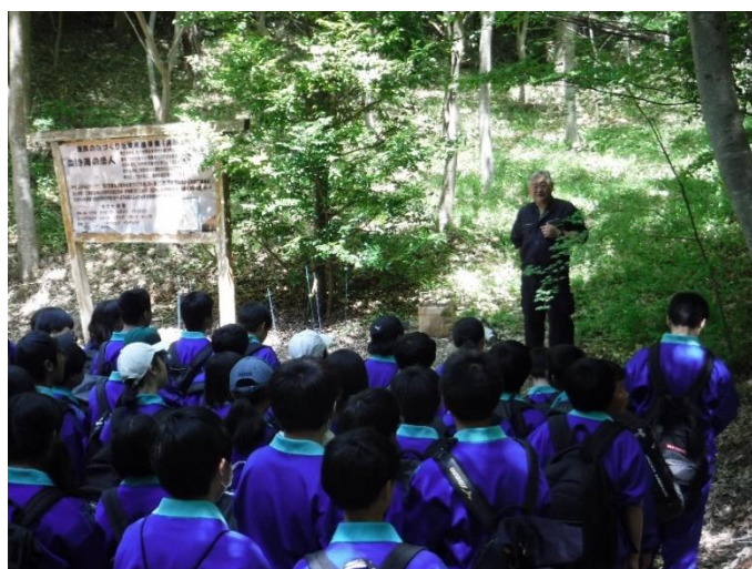
【しまね森づくり Kommission 浜田市立浜田第 2 中学校 (森の名手・名人故栗栖誠氏の山林見学)】

森づくり Kommission 以外でも、農林高校のインターシップや、私立の高等学校で毎月授業を持つたり、地域おこし協力隊を林業の担い手に育成するための研修等、健全な森林を次世代へ繋げていくための活動を行っています。