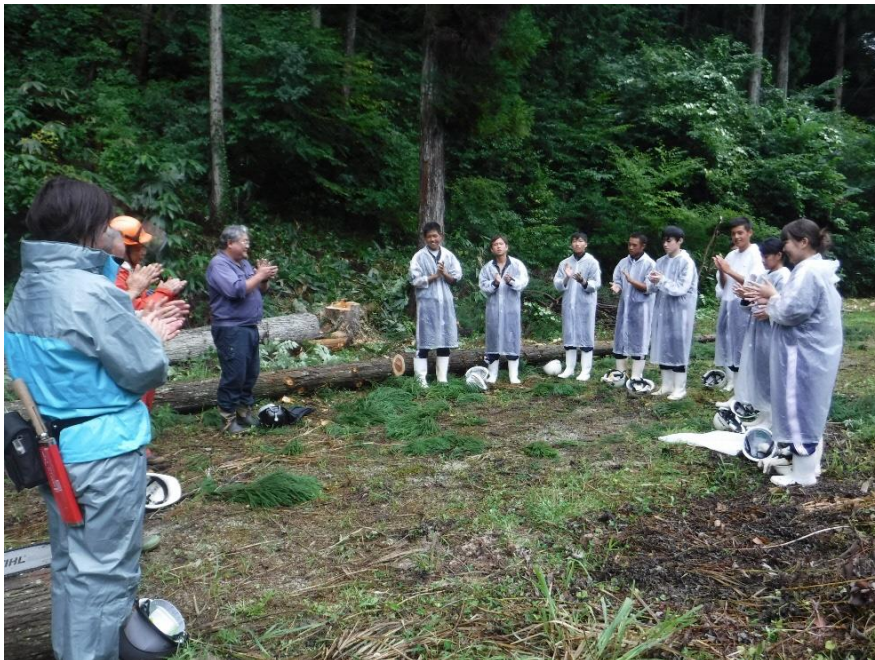
【松江農林高等学校インターシップ（飯南町：松江農林高等学校学校林）】

なかでも、もりふれ倶楽部の活動で近年特に力を入れているのが、「森林保全の大切さを次世代へ伝える活動」であり、現在、小・中・高等学校を対象とし、森林保全に関する出前講座を実施しています。