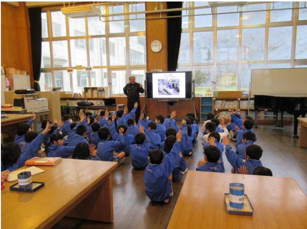
【しまね森づくりコミッション雲南市立三刀屋小学校 5 年生（森林保全の大切さの講義）

学校への出前講座は、ポイントとなる森林保全の講義とモノ作りや樹木学習等の体験を組み合わせた形で行っています。森林保全の講義では、空気・水・土という人の生存に関わる大切なものを健全な森林が与えてくれることを伝えつつ、①人工林での間伐の大切さ、②雑木林と人との関わり（例えば、エネルギー革命以前は、薪の採取や炭の生産のため、樹齢 20～30 年の雑木が伐採され、萌芽更新により更新されてきたこと等）、③里山の竹問題、④その他、マツの話や里山の循環と人との関係等の内容で、①～④の全部または一部を選択して実施しています。講義には、なるべく写真をたくさん使い、資料の文字は最小限にとどめ、対象の学年により話の内容や言葉使いを変えるなどして分かりやすくしました。