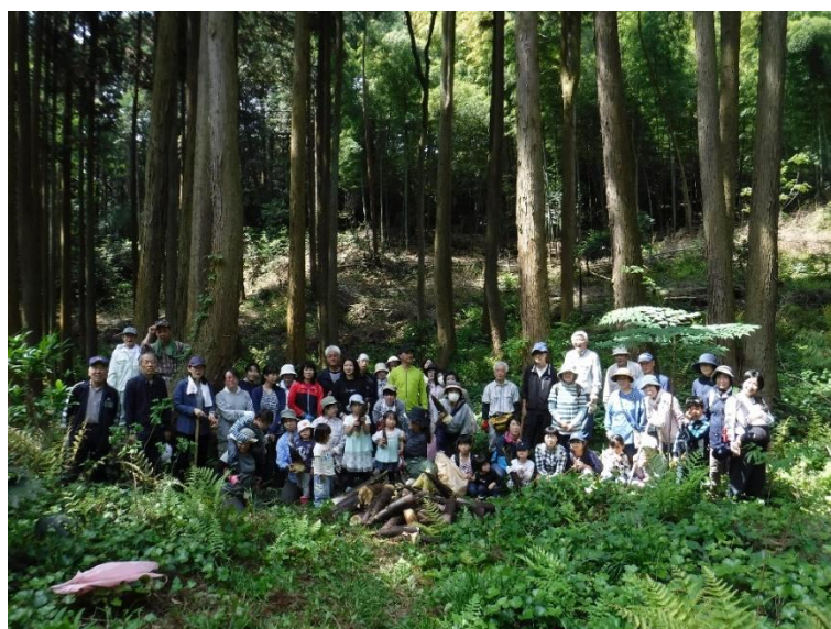
【市民参加型竹林整備イベント（松江市：楽山公園）】

活動の柱は3つあり、1.「森林保全や里山保全の大切さ」の普及啓発活動、2. 森林ボランティア活動、3. 里山生活者の支援活動です。